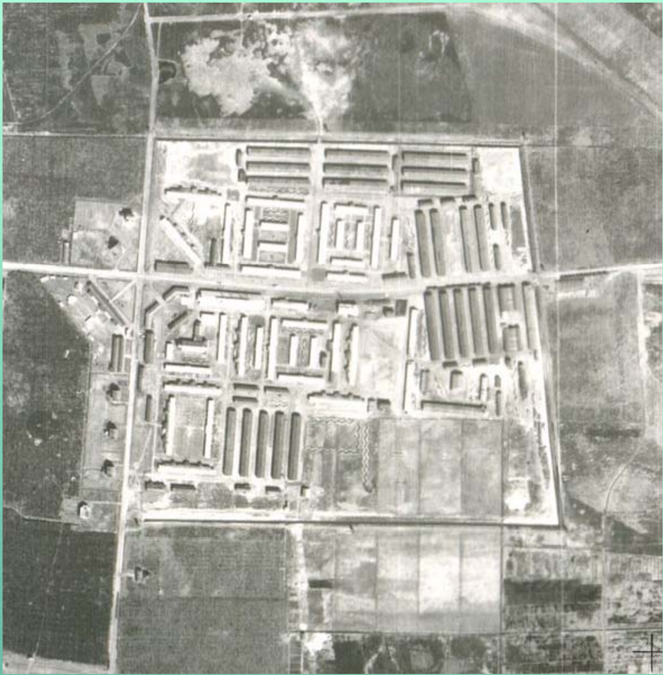
Luftaufnahme des Lagers Westerbork, März 1945