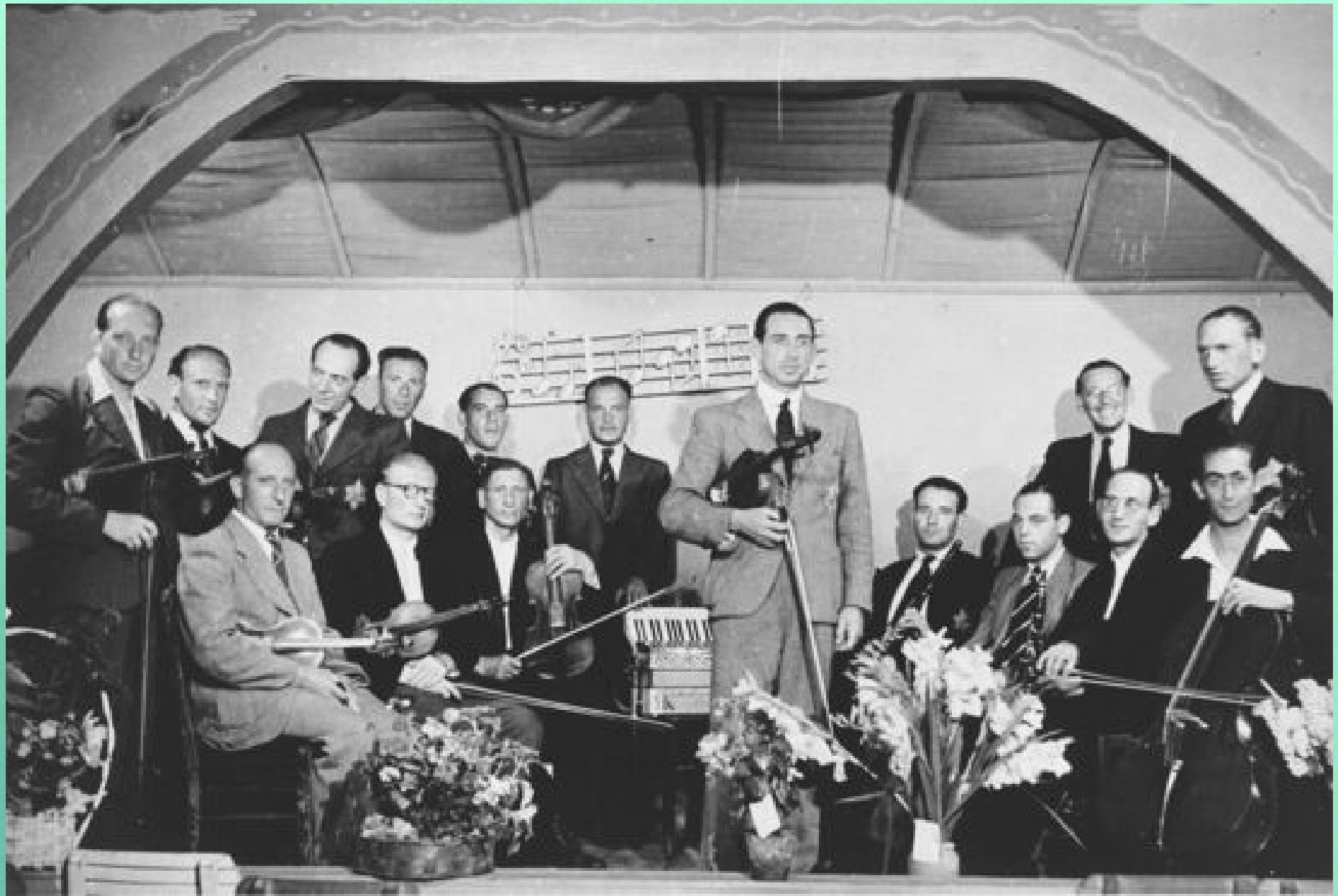
Mitglieder des Streichorchesters im Lager Westerbork