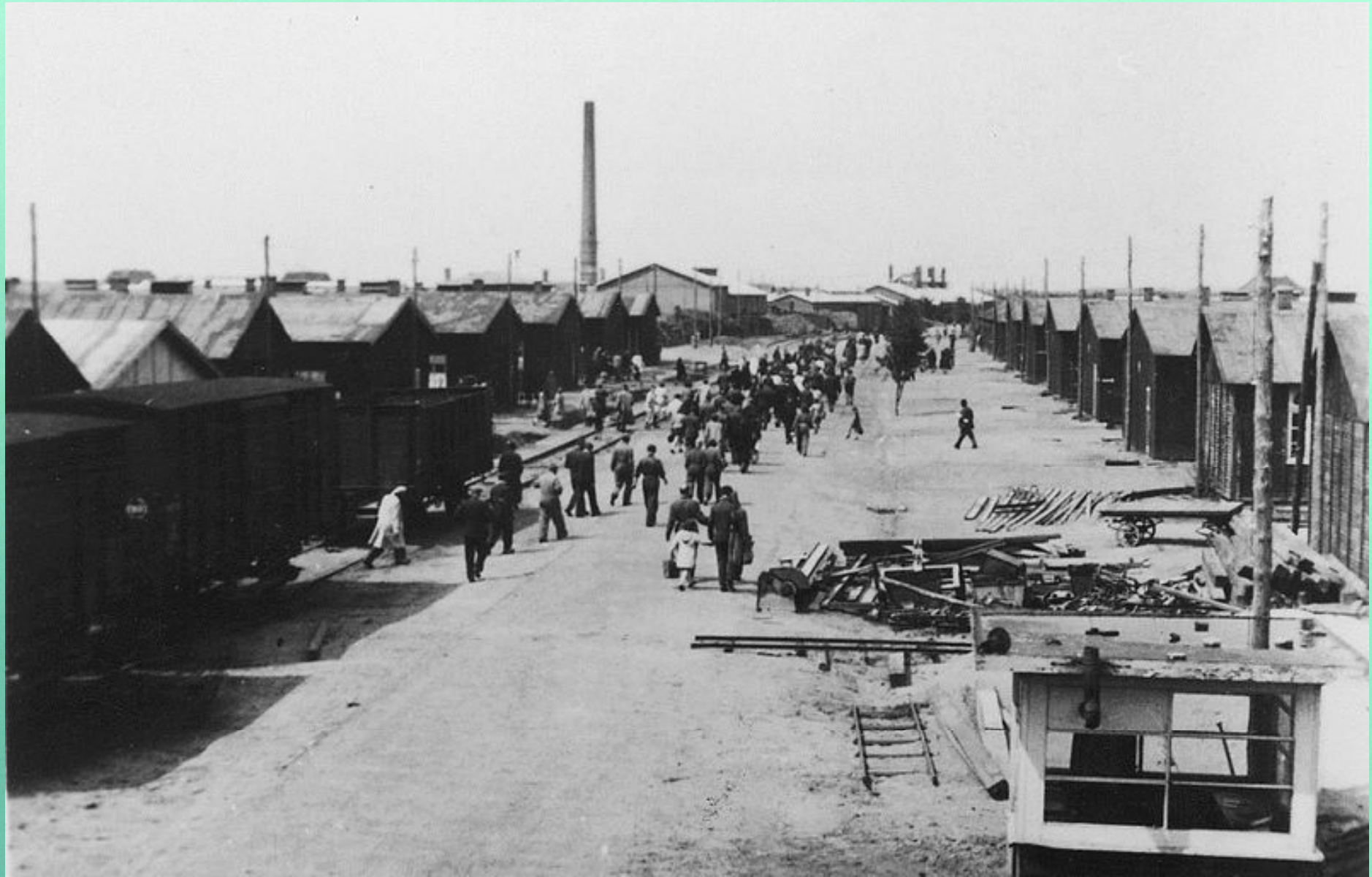
„Boulevard des Jammers“ („Allee der Leiden“, „Straße der Sorgen“)